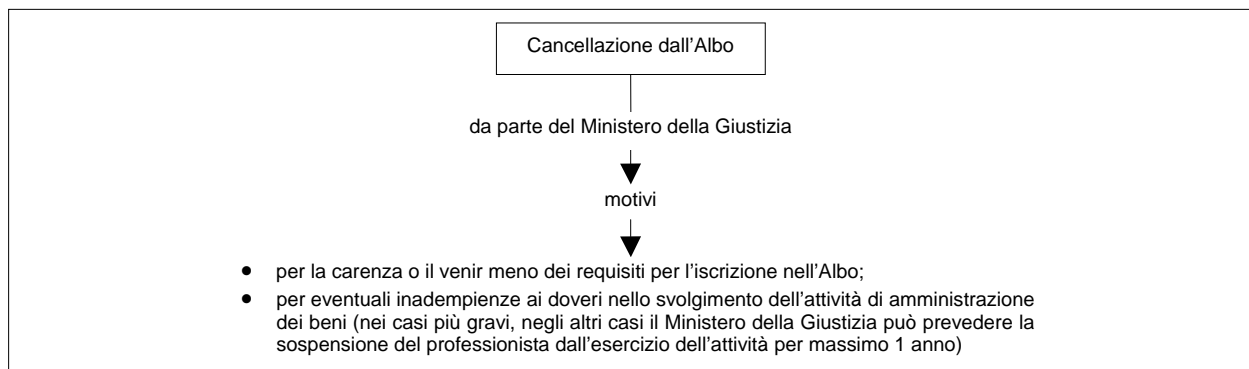
Fig. 3 - Cancellazione dall'Albo